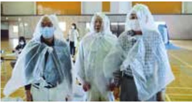
身近なもので防災グッズは作れます!

なかでも合羽の作成では身に着けながら笑顔が見られ、「家庭用ごみ袋で作成しましたが、意外と温かくて、冬に被災しても使えそうですね。」との感想が聞かれました。