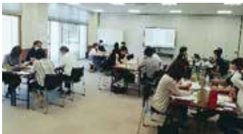
町村役場、社協と協働で事業計画等を検討する担当者会議

町村行政・社協との連携を基本に、 ①相談対象者の課題の整理と明確化、 ②必要な支援をコーディネートするプラン作成、 ③支援状況の進行管理、 ④モニタリング・再プラン作成という一連の流れの中で、対象者の課題解決を図っています。