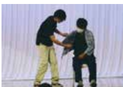
コンテスト介護場面の様子

本会では、今後も介護の魅力を発信し、福祉・介護分野の理解を深めていただく様々な取り組みを推進していきます。