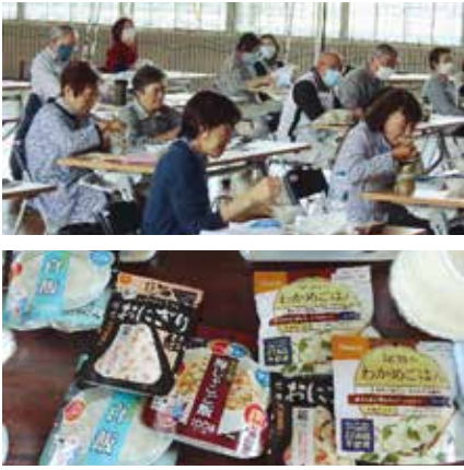
昼食は非常食で、「意外においしい」との声が聞かれました。

板柳町の直下には活断層があるほか、青森県一級河川の岩木川が流れている等、災害発生の危険性があります。近年、大きな災害は発生していません。しかし、全国的には様々な災害が多発しており、この防災体験は、板柳町社協関係者として災害への意識を高め、防災に関する知識の向上、近隣住民相互の関係性づくりを図ることを目的に開催しました。