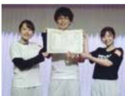
最優秀賞に輝いたチーム