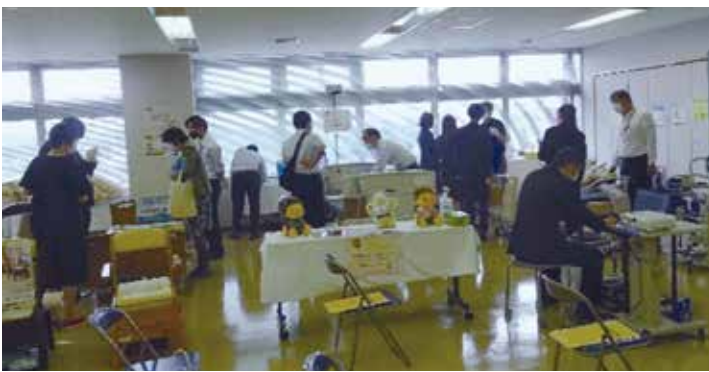
体験展示場で見て・触れて・体験いただいています。

介護ロボットに関する相談・お問い合わせは、迷わず、県社協へ！ぜひ相談窓口をご活用ください。