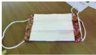
参加者が作成したマスク(上)とスリッパ(下)

午後には体験コーナーが設けられ、「身近にあるもので作ってみよう」と題して、マスク・合羽・スリッパを作成しました。マスクやスリッパは、被災地において感染症対策としても有効なものであるため、キッチンペーパーや新聞紙を丁寧に折り、実際に身につける姿が見られました。