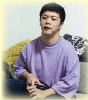
演奏歴は10年以上ですが、現在も練習をかかしません。後ろに好きなKISSのクッション。

イイ!」と思ったのがきっかけです。音楽教室に通い続け、今も週1回レッスンを受けています。ドラムの演奏は、楽譜を読んで覚えるのではなく、全て耳で聴いてドラムを叩きながら覚えます。普段は仕事をしているのであまり練習できませんが、その分休日になると長時間練習し、集中力は途切れません。