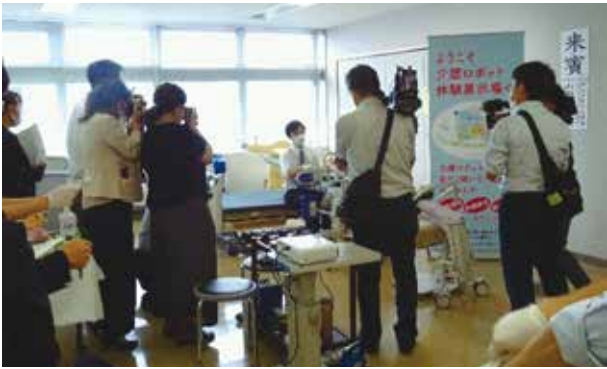
8月3日 開所式後。メディアにも注目を浴びました。

この窓口は、介護ロボットの開発から普及までを迅速に進めるため、厚生労働省が初の試みとして本会を含む全国11か所に設置したものです。 窓口では、介護現場と開発企業双方から相談を受け付ける他、常設の体験展示や実機の試用貸出、研修会なども行います。