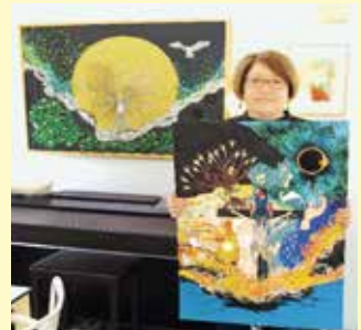
作品にはそれぞれストーリーが表現されています

「毎回、ひとつの絵の中にストーリーを考えるんです。人間と自然との共存を意識しています。人間にはいろんな面があるから、毎回違う絵になります。」と語る今さん。絵を描くことで、たくさんのお会いがありました。「一生懸命やっている」と見てくれる人がいるんです。居場所がないと思っていた地元の平内町も好きになって、今は地元で頑張ろうと思っています。