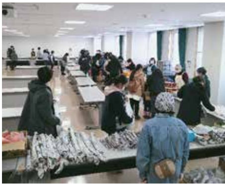
申込不要のパントリー式の運営会場は、1時間ほどで食品がなくなってしまう盛況ぶり。

↓就学費援助制度の申請に同行するとともに、「青森しあわせネットワーク」では制服を緊急支援。