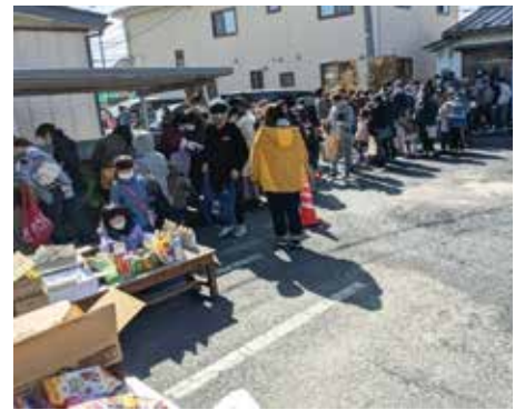
長い行列と渋滞は「子ども宅食 おすそわけ便」の名物に。