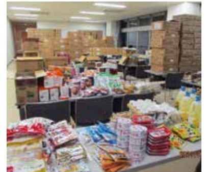
生協などから無償で定期的に寄贈いただく食品は、各地域で1回あたり1000点以上を用意。