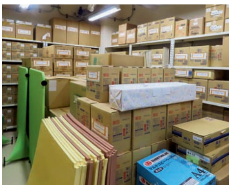
防災倉庫には様々な食料等が保管され、種類も豊富

また、防災倉庫見学時には横浜町行政職員から「センターには飲食料、生活用品が備蓄しており、発電機も屋上に設置されている。横浜町の人口は約4千人超だが、すぐに避難行動がとれない方々300人程が約3日間避難することができ。町内近辺で大規模災害が発生した場合、は弘前市に避難することとなっているが、近隣の要配慮者がいれば、センターを利用してほしい」と説明がありました。参加者からは「過去の防災訓練でも弘前市まで行ったが、要配慮者についてはすぐに避難できない。300人も避難できれば町内の要配慮者は十分避難できて安心だ」との感想もありました。