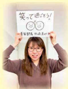
会員・部員募集中です！ 各種SNSも開設中！

青年部は、前部長が退任の際、人数不足で存続の危機に陥りましたが、少しでも自分に何かできることがあればとの思いで部長を引き受け、研修や交流の場づくり等の活動をしています。若い人の中にも耳が聞こえないことで悩み、孤立している人がいるかもしれません。そのような人達が本協会青年部に入室することで、友好関係を築くお手伝いできればうれしいです。