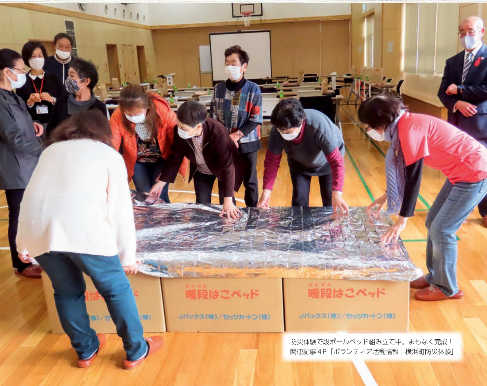
防災体験で段ボールベッド組み立て中。まもなく完成! 関連記事 4P 「ボランティア活動情報: 横浜町防災体験」