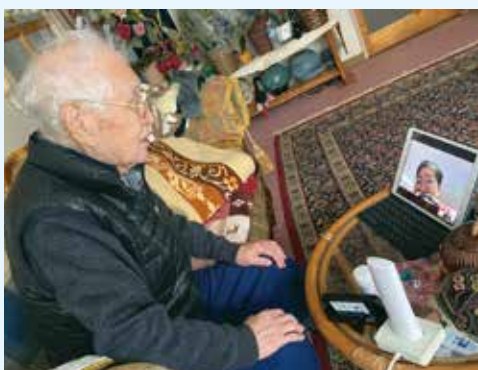
通話中も職員が付き添うのでスムーズにお話し可能！