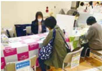
「短時間の求人もあるんですね」と希望地域の求人を見る相談者

6月7日（火）にイオンモール下田で開催した相談会には、10の方が来場し、求人情報を見ながら、