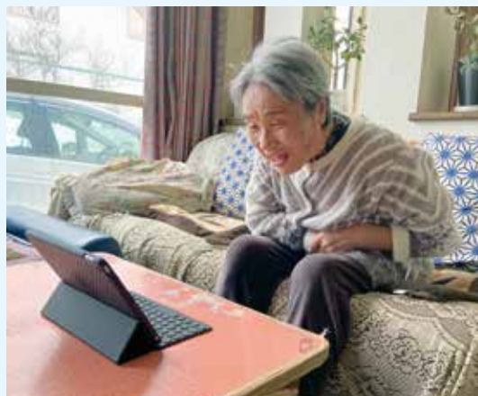
電話と違い、顔を見て話せるのもビデオ通話の魅力！

SNSの利用については、世代間の格差があるため、紙媒体と併せて活用していく必要があると考えます。