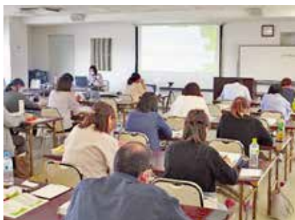
オンライン併用開催の基礎編研修会

今後は、7月に理念・基本姿勢編、9月に事例検討編と順次開催する予定で、自立相談支援機関の資質向上につなげていきたいと考えています。