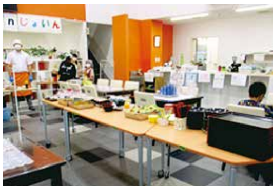
感染状況をみながら、会食やお弁当配布などの活動を続けてきた「子ども食堂じょいん」（青森市）

感染リスクに配慮しつつも、地域のごささまざまな人が食事を共にし、何気ない会話を楽しむ場は大事な場です。徐々にコロナ前の会食型の「居場所」も増えてつづいています。