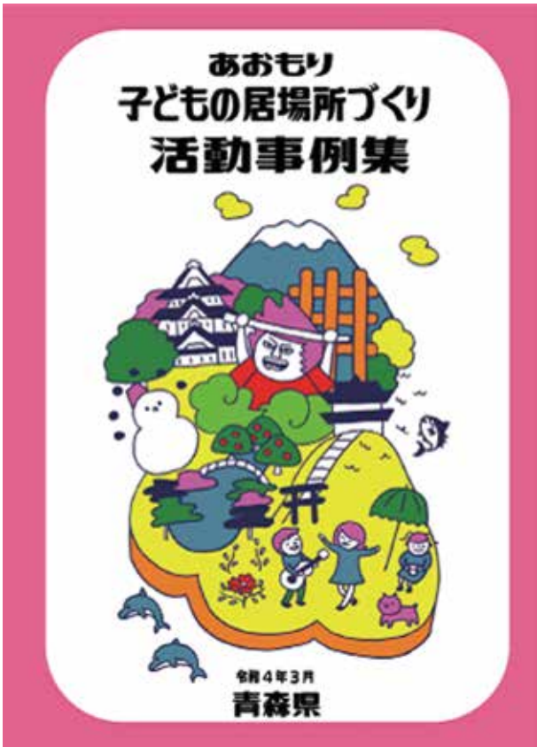
県内のこどもの居場所の事例集を3月に発行。県社協HPからもダウンロードできる。

拡大を続けた「子どもの居場所」ですが、コロナ禍において公民館などの開催場所が確保されないなどの理由で半数以上の活動が休止しました。一方で、お弁当や食材の配布、パントリーなどの活動は拡大を続け、青森県社協も県内4地域で「子ども宅食おすそわけ便」をスタートし、多くの子育て家庭にご利用いただいております。