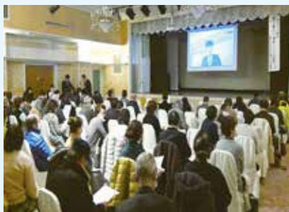
3つの会場に分けて同日開催！

新型コロナウイルス感染症の影響で事業が軒並み中止となっていました。法人内で「やることに意義がある」等の意見があったことからオンラインを活用した研修会等の開催を企画しました。