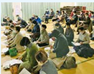
最寄りの会場で参加できる利点も！

デメリットは、ICTを苦手としている方々へのアプローチやオンライン環境を整備するに際して相当な経費を要する点です。本会では必要物品を購入するにあたり約300万円の経費を要しました。