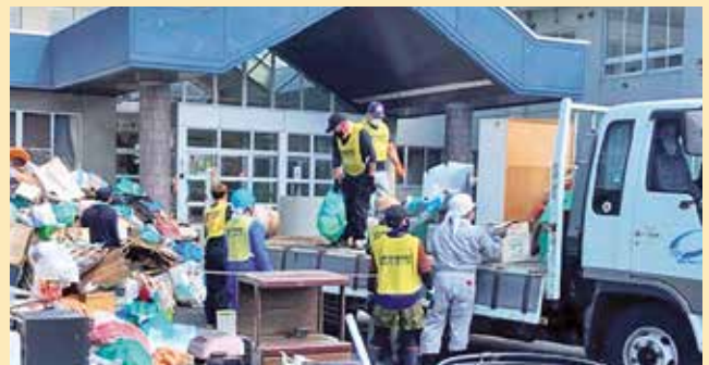
【令和4年度の拠出状況】

申請を受理した後、柔軟且つ速やかな資金の交付が可能ですので、被災時の活用をご検討ください。