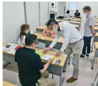
絵本が子どもの散歩にどんな豊かさを与えられるのか話し合いました

保育所等に従事している方や今後従事予定の方を対象に「絵本から広がる遊びの世界」や「気になる子どもの保護者への支援」といった実践的なテーマを5つ