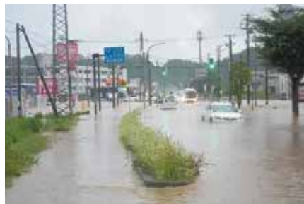
鱈ヶ沢町では中心街が水没し、日常生活復旧のため災害VCが設置されました。その他、弘前市、五所川原市、中泊町、外ヶ浜町(三厩藤島地区、平館元宇田地区)でも災害VCが設置され、支援活動が展開されました。

私たちは「ライオンズクラブ国際協会332-A地区」は令和3年4月に、青森県社協と災害時の支援に協力する協定を締結しました。地域社会に対する奉仕を行うライオンズクラブは、災害時においても初動と復興支援を「労力」「物資」「資金」を通じて支援しています。