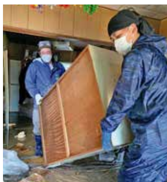
鱈ヶ沢町で家具等を搬出するライオンズクラブ国際協会332-A地区のメンバー

今回は各被災地へ赴き、行政や社協の方々や話し合い、災害VCの立上げのアドバイスや必要物資のヒアリング等を行いました。その後、各地のクラブへ要請文を通知し、災害ボランティア活動をしたり、運営側としてボランティアを支援したり、物資を調達して送ったりする等、復興を支援しました。 実際には、地域の方々が疲弊していた際には、地域の方々が疲弊している姿が見られました。生活再建が遅れるほど、ストレスやフラストレー