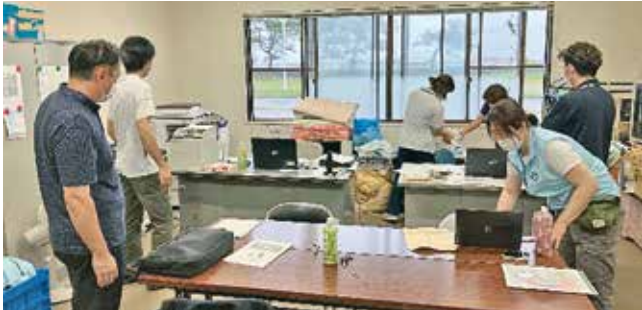
外ヶ浜町災害ボランティアセンター設置準備風景

青森県社協では、青森県福祉救援ボランティア活動本部を設置し、関係機関等と連携しながら災害ボランティアセンターの設置運営支援等を行いました。