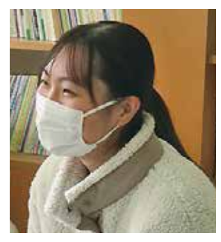
マスク越しでも笑顔が伝わるよう心がけて頑張っています！

図るために、自分から話題を作ることも大切です。これから福祉職を目指す人にもぜひ大切にしてほしいです。