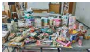
青森県民生協は、各店舗でフードドライブを実施中

コープあおもりの農産品提供では、15ヶ所の社会福祉法人を通じて、施設利用者に果物や野菜などの農産品が提供されています。