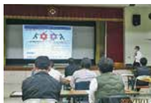
学校形式での平内町制度学習会

県内の9町村（平内町、今別町、蓬田村、外ヶ浜町、西目屋村、藤崎町、大鰐町、田舎館村、板柳町）で実施している多機関協働事業の一環として「地域共生社会実現に向けた制度学習会」を令和4年10月からスタート。学習会の内容は各町村の役場や社協が主体となって企画。福祉・保健・税務・住宅・商工等の担当や民生委員、自治会、金融機関など幅広い関係者の皆さまが参加し、断らない相談支援、つながり続ける支援、支える地域づくりなどについて理解を深める機会となっています。学習会は令和5年2月までに9町村で開催予定としています。