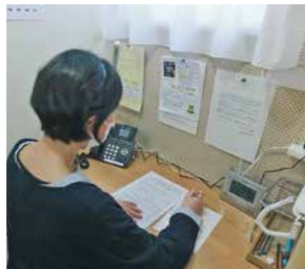
時には数時間にわたり相談に応じることもあります