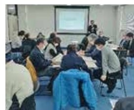
グループワーク形式での西目屋村制度学習会

県内の9町村（平内町、今別町、蓬田村、外ヶ浜町、西目屋村、藤崎町、大鰐町、田舎館村、板柳町）で実施している多機関協働事業の一環として「地域共生社会実現に向けた制度学習会」を令和4年10月からスタート。学習会の内容は各町村の役場や社協が主体となって企画。福祉・保健・税務・住宅・商工等の担当や民生委員、自治会、金融機関など幅広い関係者の皆さまが参加し、断らない相談支援、つながり続ける支援、支える地域づくりなどについて理解を深める機会となっています。学習会は令和5年2月までに9町村で開催予定としています。