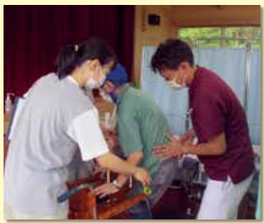
現場での入所者との関わりを大切にしています

自身のポジションが精神保健福祉士であり、精神疾患のある方の入所中のケアや地域に送り出すことが多いので、その時代に沿った対応ができるよう日々勉強して、自分を高めていきたいです。また、個人的には「一施設一筋」という目標もあるので、これからも白鳥ホームで頑張っていきたいです。