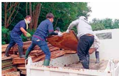
災害ゴミをトラックにて運搬する様子 ※鰯ヶ沢町災害ボランティアセンターにて

社協・役場が共に住民の声に耳を傾ける姿勢が重要です。どちらに相談しても適切な窓口につながらず、必要があれば連携をとり結果として住民の困りごとが解決できる仕組みづくりが重要となります。鰯ヶ沢町では重層的支援体制整備事業を実施しています。様々な事業やサービスを展開することで持続可能な地域共生社会が生まれてきます。住民に頼りたいではなく住民の声に耳を傾けることが頼られる第一歩だと私は思います。