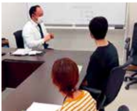
伴走による 若者サポステへのつなぎ

ひきこもっている「本人」と相談員の面談が実現できたケースでは、多くの場合、就労や社会参加活動、若者サポステや医療機関などの関係機関につなげることができています。本人との面談が難しい、支援拒否などのケースでは支援が長期化することが多いですが、ご家族との定期面談を行うなど、アウトリーチ活動を継続し「つながり続ける支援」を行っています。