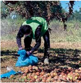
昨年8月の大雨災害によって被害を受けたリンゴを拾い清掃する支援活動

弘前大学地域創生本部ボランティアセンター（以下、同センター）は、ボランティアを通じて、課題解決と地域社会に貢献することを目的に平成24年10月に設立されました。同センターは、ボランティアの派遣を円滑に行うため、地域と大学の仲介機能を果たしており、「野田村支援交流活動」や子ども達への学習支援、除雪等、多岐にわたるボランティア活動を実践しています。令和5年2月現在、557名（弘前大学在学生の約8%）の学生が同センターに登録しており、今回は、実際に活動している学生お一人にお話を伺いました。