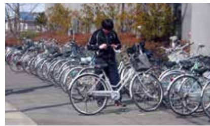
一列に並び高校生ボランティアの自転車 ※八戸市災害ボランティアセンターにて

東日本大震災の被災者支援のため、災害ボランティアセンターを開設し、延べ79日間で2392人のボランティアが支援してくださいました。春休み中のたくさんの高校生も駆けつけてくれて、福祉会館の玄関前に自転車がいっぱい並んで光景に胸が熱くなりました。これまでの地道な福祉教育への取組は、すぐには目に見えない成果は得られないけれど、