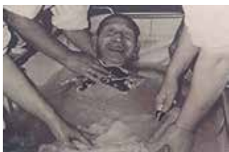
ボランティアと入浴車がつながり、笑顔広がる。(昭和60年の市社協広報から)

一人ひとりに向き合う支援が求められる今こそ、分野を超えて夢を広げる「つながりの再構築」を、真剣に先導する時だと考えています。