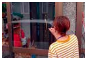
アウトリーチの一環としての自宅訪問

ひきこもり状態にある方の相談はご家族からいただくことが多く、ご家族との面談を通じて、事前情報の把握、自宅訪問などの支援方法の整理を行います。