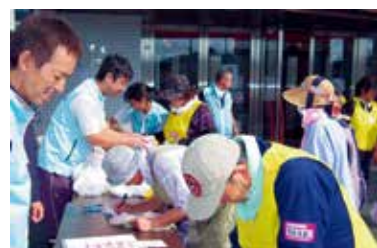
県内外から駆けつけたボランティアの皆さん ※南部町災害ボランティアセンターにて

ンター立上げにより、役割を担い、存在感を示すことができた達成感、社協職員で良かったと実感しました。