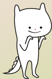
青森県福祉人材センターマスコット ふくふく

【実施期間】 令和7年4月1日から令和8年3月31日まで 【派遣対象】 本講座を希望する県内の小学校、中学校、高等学校及び特別支援学校 【主催】 社会福祉法人青森県社会福祉協議会 青森県福祉人材センター 【後援】 青森県教育委員会、公益社団法人青森県私学協会 公益社団法人青森県老人福祉協会、青森県社会福祉法人経営者協議会